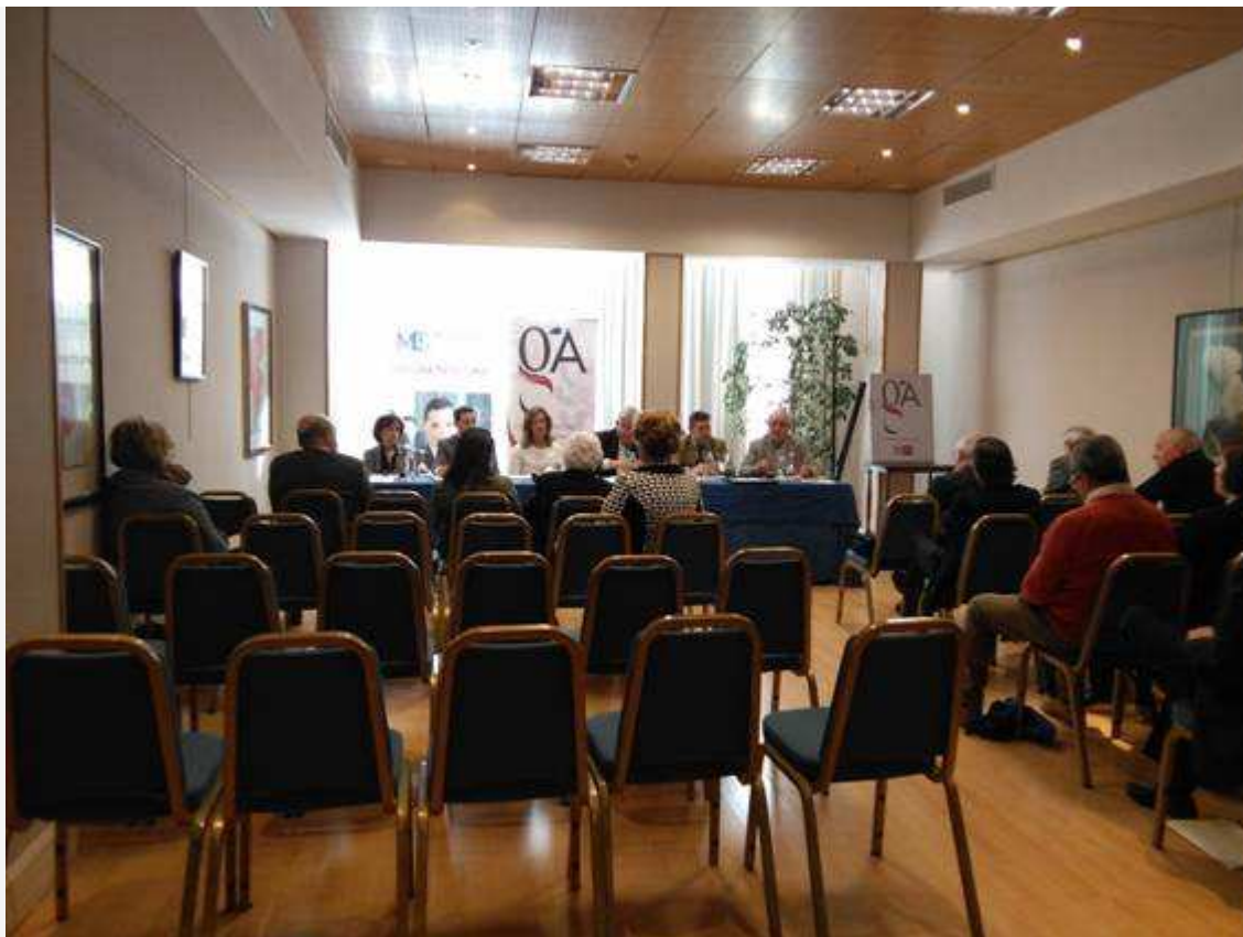
Asamblea territorial de la Mutua de Gestores Administrativos celebrada en Valladolid